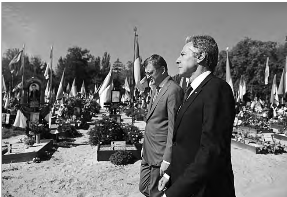
Ентоні Блінкен та Дмитро Кулеба вшановують пам'ять загиблих воїнів на Берковецькому цвинтарі.

«Українці мають важливу місію в Нью-Йорку, щоб продовжувати пояснювати — своїм союзникам і партнерам по всьому світу — що відбувається і що вони постійно пот-