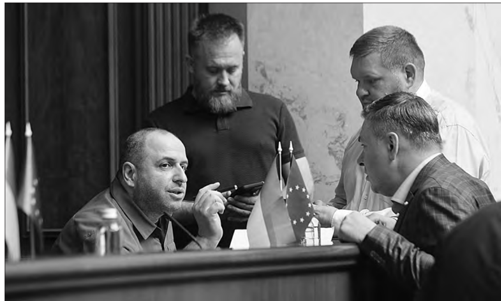
Новопризначений міністр оборони України Рустем Умеров (ліворуч) спілкується з народними депутатами.

Відповідно до проекту, створена Служба дисциплінарних інспекторів опрацьовуватиме скарги на суддів та готуватиме за ними проекти рішень стосовно того, чи слід певного суддю звільнити або іншим чином притягати до відповідальності.