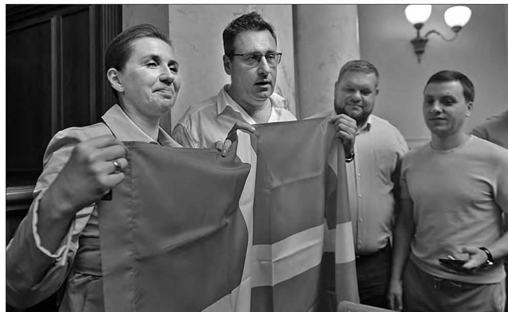
Прем'єр-міністр Данії Метте Фредеріксен в українському парламенті.

Олена ГОРБУНОВА. Більше фото тут — www.golos.com.ua